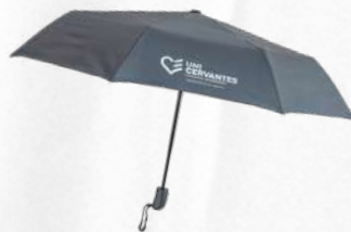
Sombrilla Plegable Automático

Paraguas de 8 cascos con botón de apertura/cierre automático y estructura en fibra de vidrio. Su cobertura de 95 cm te mantiene protegido en todo momento. Incluye funda y correa de agarre.