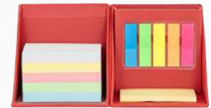
Set de Notas Memo Cube

El organizador definitivo para tu escritorio. Un cubo ecológico compacto que integra portabolígrafos, cientos de notas de papel y banderitas adhesivas de colores para que nunca pierdas una idea importante.