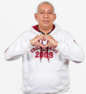
Hoodie con capota Color blanco Talla: S, M, L, XL (Unisex) $151.000