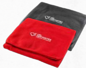
Cobija Flis Ovejero (100 x 150 cm)

La compañera perfecta para el frío. Ligera, extremadamente suave al tacto y con un gran nivel de aislamiento térmico.