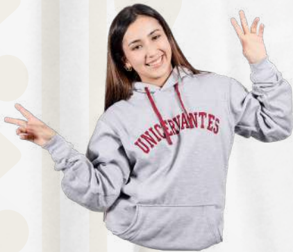
Hoodie con capota Color gris Talla: S, M, L, XL (Unisex) $119.000