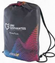
Tula Personalizada Impermeable

Práctica, ligera y resistente al agua. Estampada a todo color en la parte frontal, equipada con ojales y cordones ajustables para llevar todo lo que necesitas de forma segura.