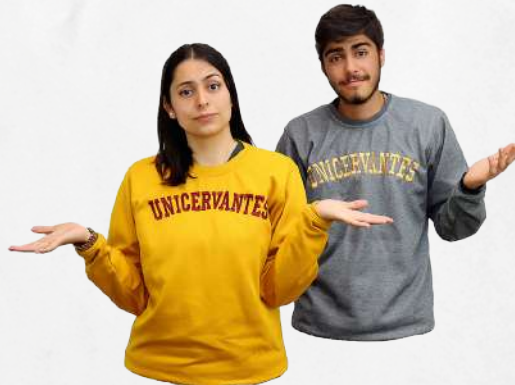
Sweatshirt Color gris y mostaza Talla: S, M, L, XL (Unisex) $104.000