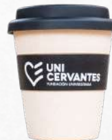
Mug de Bambú con Banda de Silicona

La alternativa sostenible y con estilo para el día a día. Vaso ligero de 350 ml con banda antideslizante para proteger tus manos de la temperatura y tapa de silicona. Su formato compacto es ideal para llevar a cualquier parte.