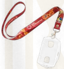
Kit Cinta Premium 2cm + Porta Carnets

¡La mejor presentación para tus credenciales! Cinta cómoda y resistente con estampado a todo color para que tu logo resalte al máximo. Incluye porta carnets para una solución completa.