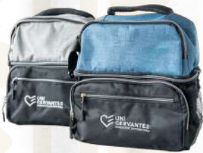
Lonchera Compacta Premium 8L

El equilibrio perfecto entre capacidad y diseño. Su interior impermeable garantiza el cuidado de tus alimentos y bebidas (hasta 12 latas), mientras que sus 5 bolsillos auxiliares te permiten organizar todo lo necesario.