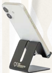
Soporte Metálico Antideslizante

Práctico, estable y de estilo minimalista. Base metálica para dispositivos móviles que garantiza un agarre seguro gracias a sus soportes de silicona. Su diseño compacto es el complemento perfecto para cualquier espacio de trabajo.